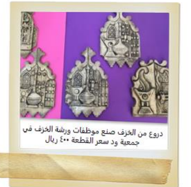
دروع من الخزف صنع موظفات ورشة الخزف في جمعية ود سعر القطعة ٤٠٠ ريال